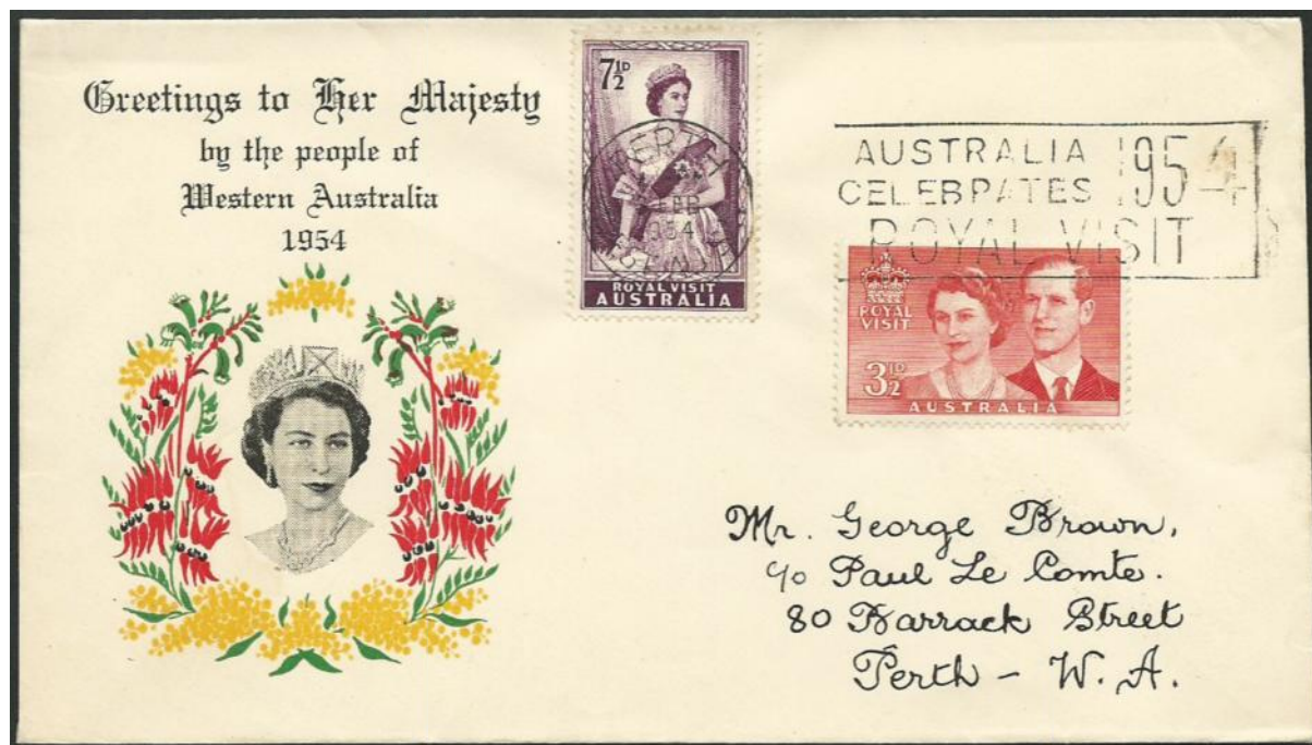
Abb.1: Boans FDC, abgestempelt am 2. Februar 1954 in Perth mit dem Sonderstempel zum Staatsbesuch von Königin Elisabeth II in Australien.

In diesem Zusammenhang erwähnte er auch die zu diesem Anlass verwendeten Sonderstempel. Hier möchte ich einen der Sonderstempel auf einem Schmuck – FDC vorstellen.