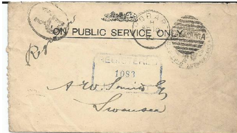
Typ 1: Brief vom 10.4.1890 schwarz