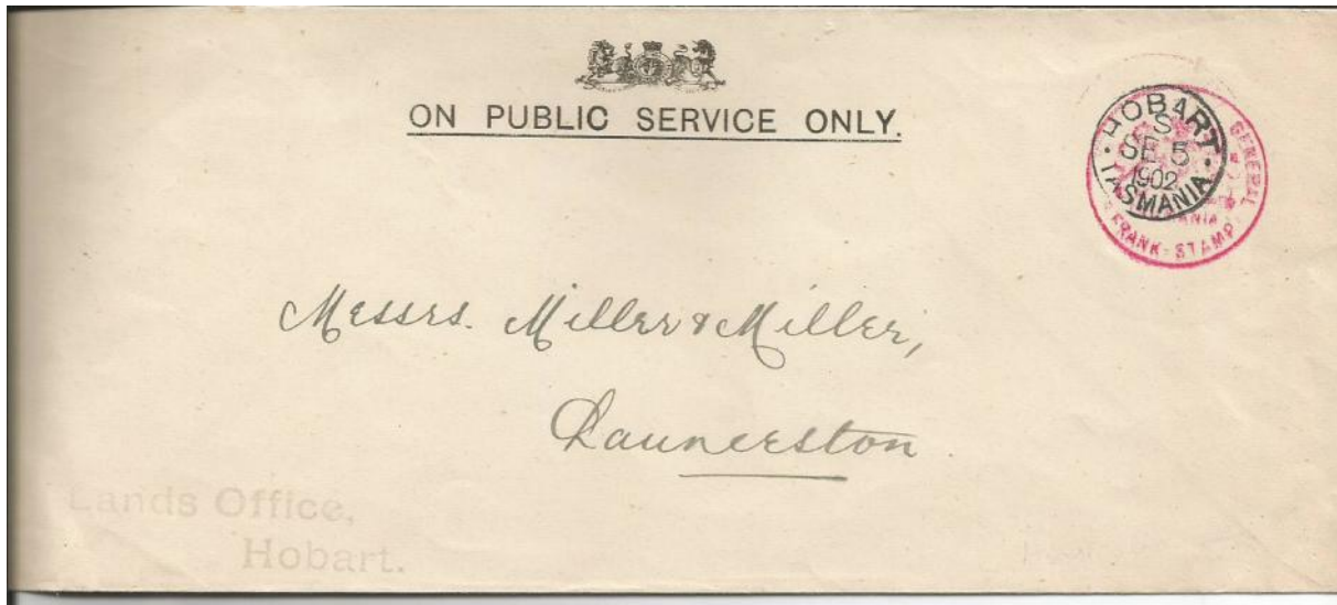
General: nicht in der Liste enthalten. Brief vom 5.9.1902 rot Typ ?