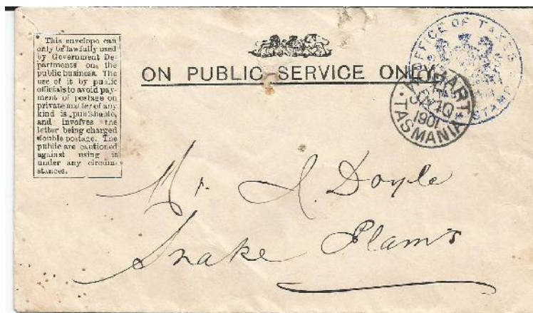
Typ 1: Brief vom 10.1.1901 blau